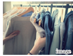
D 2つの壁一面大容量クローゼット

洋室1・2のクローゼットは壁一面に設置。上着やコートなどのかさばる衣類も保管できる十分な大きさを確保した収納スペースです。