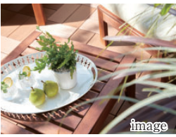
B 南向き2WAYバルコニー

洋室1・2と繋がる南向きバルコニーはガーデニングなど趣味のスペースやテイクアウトなど少し贅沢な時間を過ごせるスペースです。