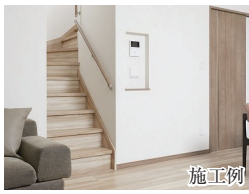
C 毎日家族の顔が見えるリビング階段

リビング階段にすることで忙しい毎日でも家族間のコミュニケーションを取りやすい設計に。