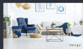
D 家族の会話が弾む 20帖超LDK

20帖超の広さに加え、光と風を招き入れる南側窓や、家族の会話が弾む対面キッチンなど、心から寛げる工夫を施したLDKをご用意しました。