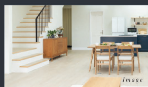
C 会話が自然に育まれる リビング階段

家族が出掛ける時や帰宅した時に、リビングを通過するプランです。「おはよう」「ただいま」など、家族の会話が自然に育まれる我が家になります。