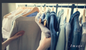
B 便利な快速収納 ウォークインクローゼット

上着やシャツなどをたくさんしまえる大容量の収納です。収納ボックスなどを利用すれば、ファッション小物も整理して保管できます。