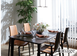
D 明るい空間へ 南側ワイドサッシ

南面のワイドサッシが明るく爽やかな空間を演出。開放的で穏やかな家族団楽のひとときを過ごすことができます。