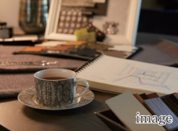
B 自分時間をつくる 2階のくつろぎ空間

1階にパブリック、2階にプライベートフロアを配置。プライバシーに配慮された、心地よい室内で自分時間を満喫できます。