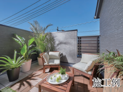
C 開放感あふれる 約6.1帖ワイドバルコニー

青空の下で趣味を満喫したり、テーブルとチェアを置いてオープンカフェ気分を味わうなど、贅沢なプライベート空間を演出します。