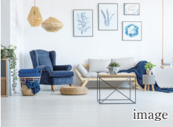
A 明るく爽やかな リビングダイニングキッチン

家族が集まるリビングは約19.4帖の広さを採用しました。3面採光窓で明るく爽やかな住空間となるため、伸びやかな暮らしが叫びます。