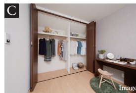
SICやダブルクローゼット、Shelfなど多彩な収納設備

Master Bed RoomとBed Room2から出入りできるBalconyは開放的なスペース。家事がしやすい動線を実現した、光に包まれる心地良い空間です。