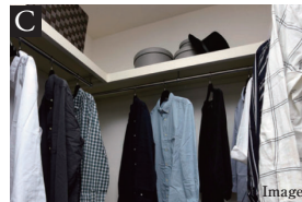
SICやShelf、ダブルWICなど豊富な収納設備

Master Bed RoomはBalconyとの一体感を感じさせる広々スペース。ライフスタイルに合わせ、WICの撤去可能壁を外すことでさらに開放感を高めます。