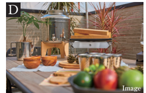
開放感を高める広々Wide Balcony

玄関のSICや、家事用品を収納できるShelfなど収納設備が充実。またMaster Bed Roomには大容量のWICを2カ所に設置しています。