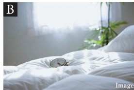
約10.7帖のMaster Bed Room

南向きのLDKは2面採光を実現した明るくワイドなスペース。来客時にはBed Room1の扉を開放することで、約23.3帖の広々としたパーティスペースとしてもご利用いただけます。