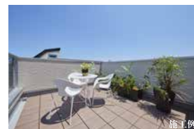
D 光満ちるスカイバルコニー 2階LDKの上部に設けたスカイバルコニーは、キッチンとの移動も楽々。陽光につつまれる休日のランチやカフェタイムを気軽に楽しめます。