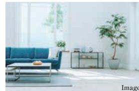
A 大型収納のある2階LDK LDKや水まわりといったパブリックスペースを2階に集約させたプラン。勾配天井で開放感のあるリビング、ダイニング横には大型収納を配しました。