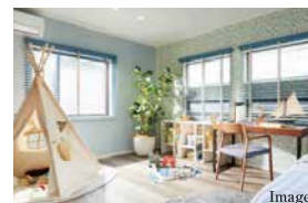
B つながる1階の2居室 ベッドルーム1と2は、引戸の開け閉めによって1室にも2室にも利用できるフレキシブル仕様。家族の成長やライフスタイルの変化を見据えたプランニングです。