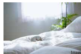
C 明るさにも配慮したマスターベッドルーム ワイドなクローゼットを備えた約7.2帖のマスターベッドルーム。トップライトから明るい光が降り注ぐ空間は、ワークスペースなどにも利用が可能です。