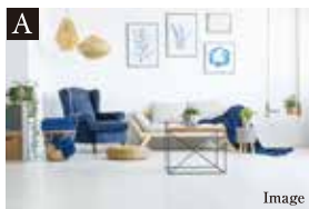
A センターキッチンのあるLDK

360度自由に行き来できる動線確保した開放的なカウンター付きのセンターキッチン。カウンターは食事スペースや作業台スペースとしても使えて便利です。