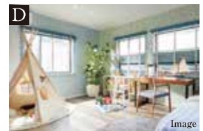
D 撤去可能壁付きベッドルーム

収納スペースの他にも、多様に使えるステップインストレージ。季節の家電や衣類などの収納はもちろん、座って本を読んだり寝転んだりしてリラックスできる空間としても楽しめます。