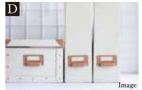
D 空間をスッキリ見せる収納スペース

車2台分の広さを確保したゆとりあるカースペース。普段使用のほか、来客用としても使えるので快適なカーライフが可能です。