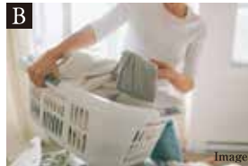
B 多彩に活用できるユーティリティ

1階のリビング・ダイニングの横に設けた+αルームは、子供部屋やワークルーム、趣味の部屋や収納空間として家族のライフスタイルによって多様に利用できます。