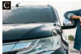
C 2台駐車可能なカースペース

家事や収納スペース、また、仕事をするための空間として使えるユーティリティ。バルコニーへ出入りできるので、例えば洗濯物を干してダイレクトに取りこめるクローゼットとして使えます。