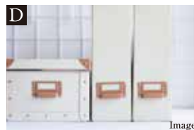
D 収納力のあるステップインストレージ

靴を履いたまま出入りができる、シューズインクローゼットを設置。広々とした空間なので、靴やブーツ以外にもベビーカーやゴルフバッグなども収納でき、玄関がスッキリと見せられます。