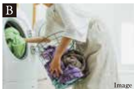
B 家事を効率的にこなせる2Fの動線

約16.3帖のLDKは最大天井高約3.6mの勾配天井。通風と採光を効果的に空間へとりいれます。またリビング隣接の洋室の扉を開けることで、さらに開放感が高まります。