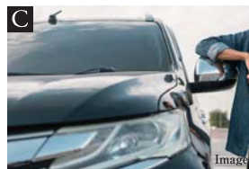
C 2台駐車可能なカースペース

家族の靴をたっぷり収納できるSICやMaster Bed Roomのクローゼットなど収納設備も多数設置。キッチンには、食材やキッチン用品を収納できる床下収納もついています。