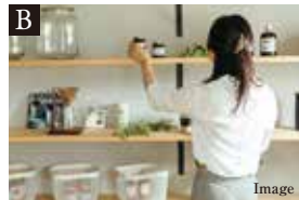
B 多彩な収納設備を採用

玄関スペースには家族の靴をはじめ、ブーツや傘まで収納できるSICを設置。玄関まわりをスッキリと見せることができます。