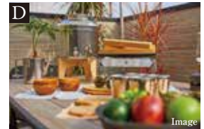
D 2部屋から行き来できるWide Balcony

リビングにいる家族のコミュニケーションが増える対面キッチンには、複数のお料理を同時に作れる三ツツロコを採用。ゴミの出し入れもしやすい勝手口も設置しています。