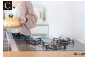
C 機能性あふれるキッチンスペース

各居室のクローゼットなど収納設備を多数採用。キッチン横には食器や調理器具、食材などをたっぷり収納できるパントリーを設置しています。