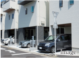
B 濡れずに快適 ビルトインカースペース

屋根や壁に囲まれたビルトインカースペース。雨が降っていても濡れずに乗降できるので、快適なカーライフをサポートしてくれます。