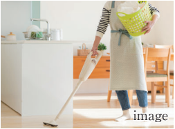
C 回遊性のある キッチンエリア

アイランド型のセミフラットキッチンを採用。回遊動線で使いやすく、近くに学習カウンターも備えた、家族が毎日心地よく過ごせる空間です。