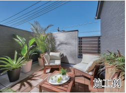
D 多彩な用途が広がる 約4.1帖ワイドバルコニー

主寝室から出入りできる、約4.1帖のワイドバルコニー。ガーデニングを楽しんだり、テーブルとチェアを置いてティータイムを楽しむなど、少し贅沢な時間を過ごせるスペースです。